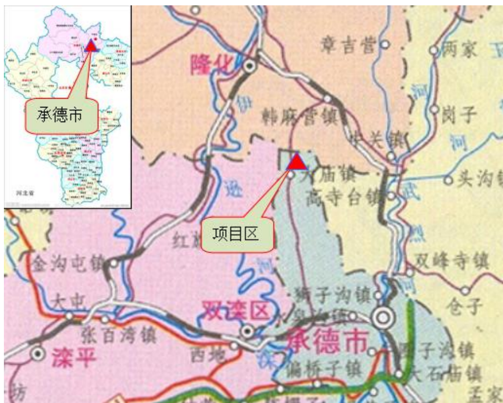
图 1-1 工程地理位置图

承德市双滦建龙矿业有限公司东方铁矿位于河北省承德市双滦区大庙镇北梁村,距双滦城区 15km。距离选厂直线距离 7000m,采矿区道路与项目区外 s256 省道相连,为便于生产运行中存放废石,在采场附近修建排土场两座,采场和排土场之间由场内运输道路相连,交通便利。地理坐标为:东经 117^{\circ} 48' 、北纬 41^{\circ} 11' 。地理位置见图 1-1。